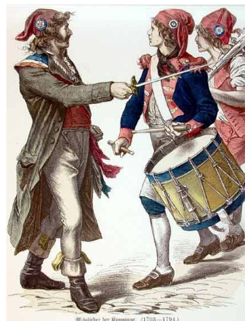
Mitglieder der Mommune. (1793—1794.)

Auf dieser Führung erfahren Sie, was in Landau in der Zeit der französischen Revolution passiert ist und wie die Landauer damit umgegangen sind. Sie gehen auf die Suche nach den Spuren, die diese Epoche in Landau hinterlassen hat. Dabei hören Sie von Jakobinern, Sansculottes und vielen Zeitgenossen. Außerdem erfahren Sie, wo die Guillotine gestanden hat und was es mit dem Jaköbel auf sich hat.